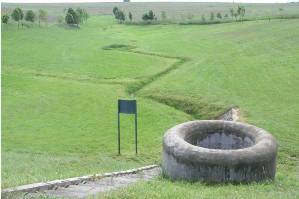
Suchá retenční nádrž v k.ú. Pustá Polom

Podpora se bude poskytovat jako příspěvek na vynaložené způsobilé výdaje, a to ve výši 100 % způsobilých výdajů. Příspěvek EZFRV činí 75 % veřejných výdajů. Příspěvek ČR činí 25 % veřejných výdajů.