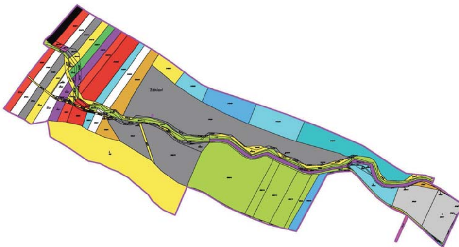
Stav půdní držby před pozemkovou úpravou – k. ú. Opatovice u Vyškova

Plán společných zařízení obsahuje účelové komunikace (zpřístupnění pozemků) , protierozní opatření , vodohospodářská opatření , opatření k ochraně a tvorbě životního prostředí a zvýšení ekologické stability krajiny .