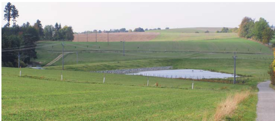
Protipovodňová retenční nádrž v k.ú. Němčice a k.ú. Žďár u Blanska