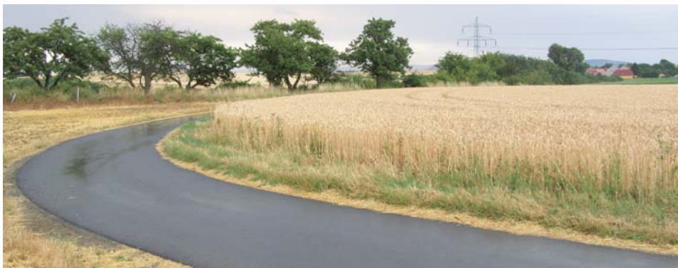
Polní cesta v k.ú. Ořechov u Brna