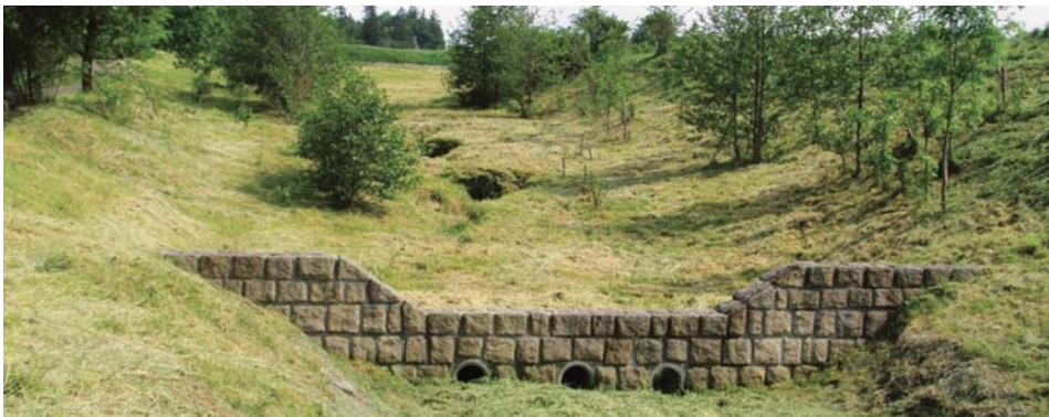
Protipovodňová přehrážka v k.ú. Lichnov

Rozsah pozemkové úpravy je vymezen jejím obvodem. Rozumí se jím území dotčené pozemkovými úpravami, které je tvořeno jedním nebo více celky v jednom k.ú. Je-li to k dosažení cíle pozemkových úprav vhodné, lze do obvodu pozemkových úprav zahrnout rovněž pozemky v navazující části sousedícího k.ú.