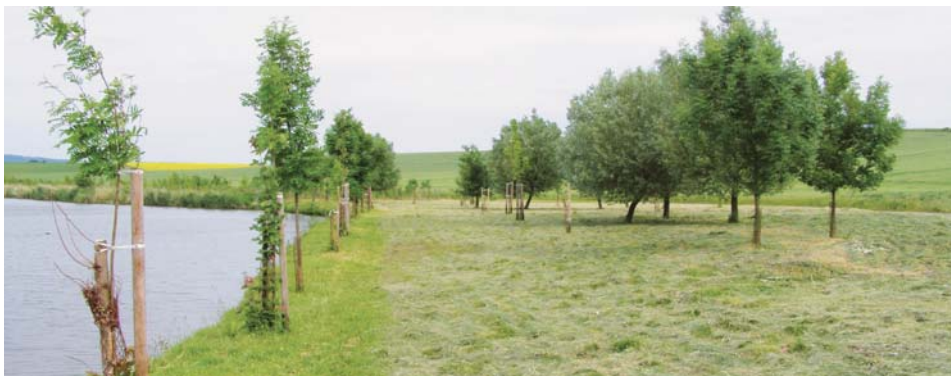
Retenční nádrž včetně ozelenění břehů v k.ú. Želeč na Hané