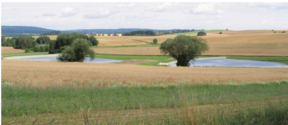
Retenční nádrže na Českomoravské vrchovině

Podrobný průzkum terénu se provádí v celém obvodu pozemkových úprav. V případě potřeby z hlediska ochrany pozemků před vodní erozí a před povodněmi nebo pro řešení dalších opatření v oblasti vod se provede i v lokalitách na něj navazujících (dílicí povodí). Průzkum se provádí tak, aby byl zjištěn skutečný stav využívání území.