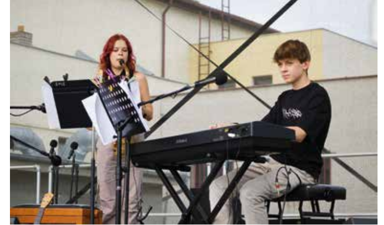
Bojanovský festival hudby a jídla – Ztratěné klíče

Celá akce by se neobešla bez personálního zajištění pracovníků z obce, prodejců, stánkařů,