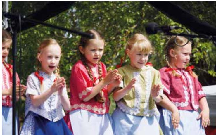
Bojanovský festival hudby a jídla – Slunéčko