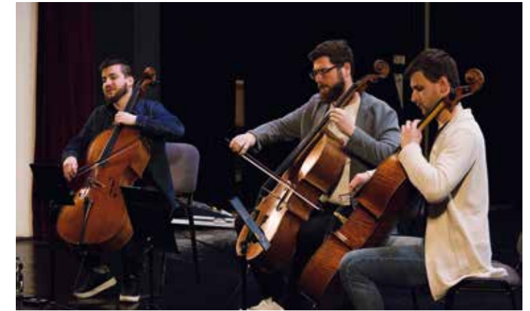
Jarní hudební festival – Osamělé palačinky