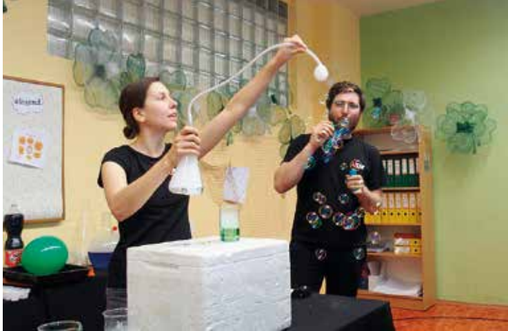
Den Země – pokusy