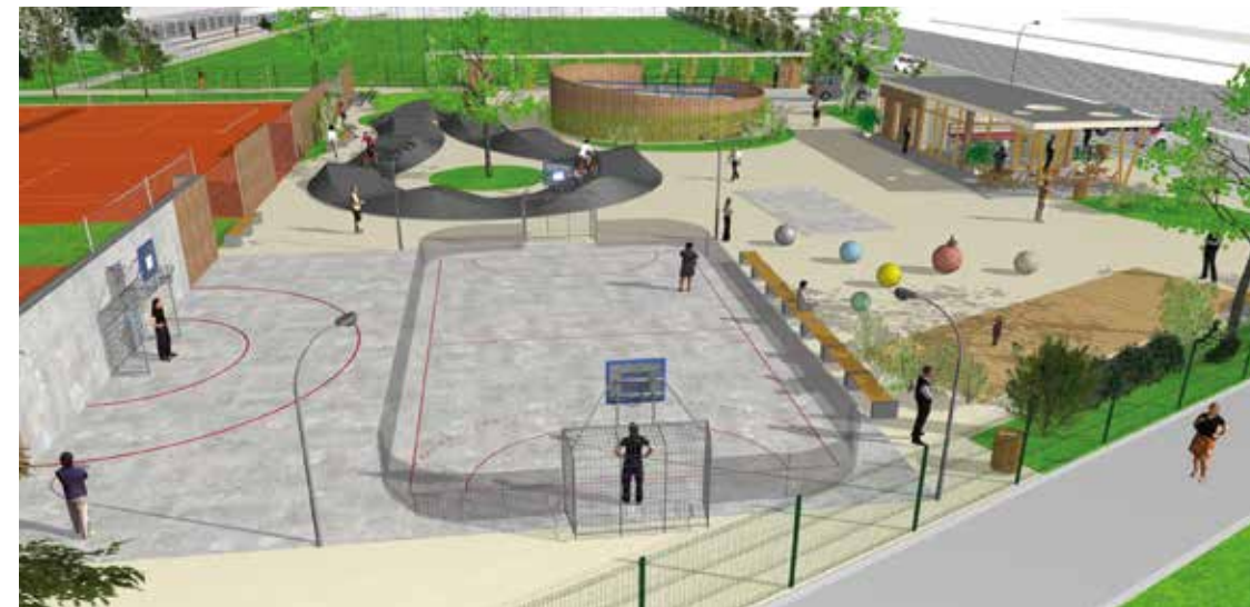
Návrh víceúčelového hřiště v ulici Sportovní

Zcela bez problémů proběhlo prodloužení kanalizace z ulice