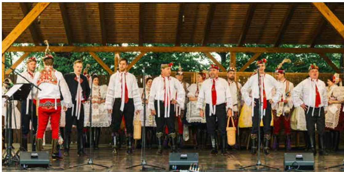
Festival Podluží v písni a tanci