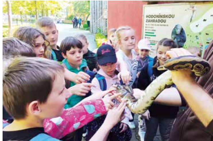
Den Země – návštěva Zoo Hodonín