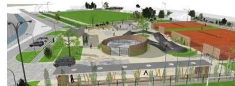
Návrh víceúčelového hřiště v ulici Sportovní

O krok dále je také oprava fasády základní umělecké školy a výstavba volnočasového víceúčelového hřiště ve sportovním areálu. V minulém čísle obecního Zpravodaje byly zmíněny ankety v souvislosti s oběma připravovanými projekty. U obou záměrů byly vybrány návrhy