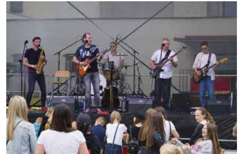
Bojanovský festival hudby a jídla – TaXmeTu