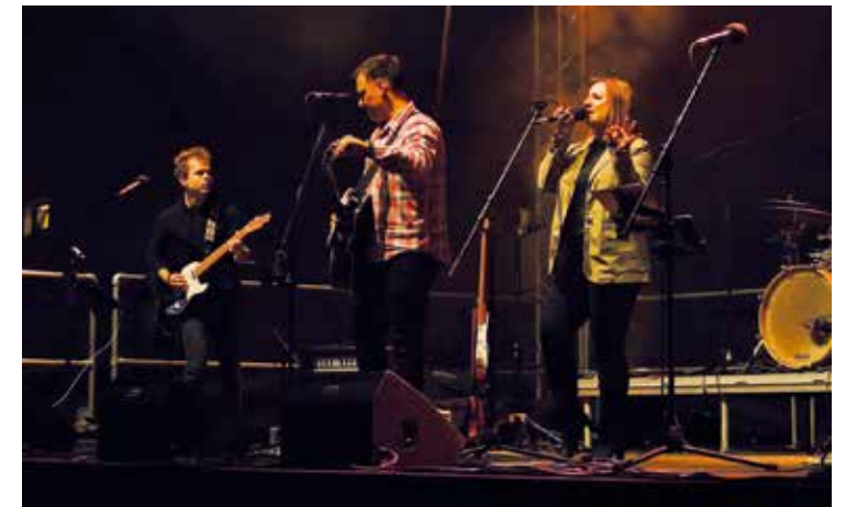
Bojanovský festival hudby a jídla – EREMY