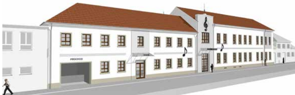
Vítězný návrh na opravu fasády ZUŠ

Další investici, kterou na domě s pečovatelskou službou chystáme, je oprava kuchyně, která si po letech služby rekonstrukci už zaslouží. Po nezbytných projekč-