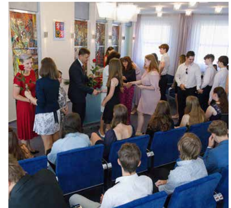
Prázdniny si užijí především žáci devátých tříd