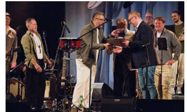
Jarní hudební festival – B-SIDE Band