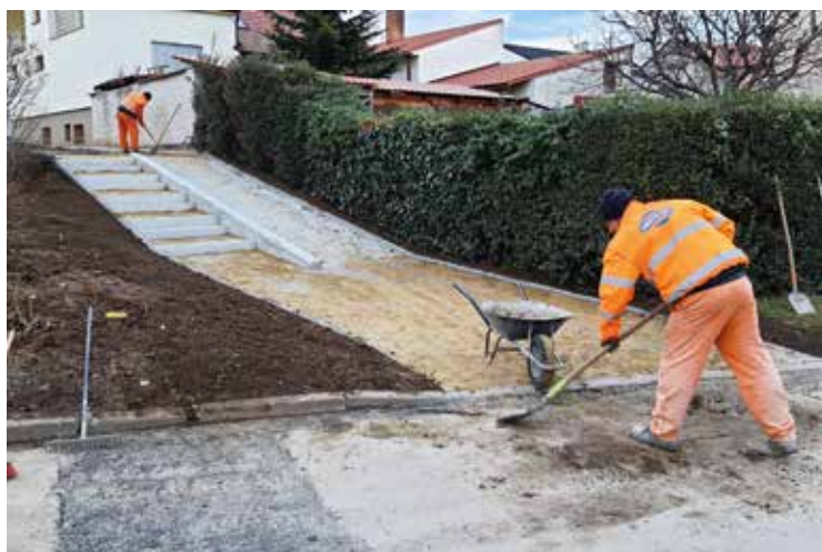
Schody ulice Cacardov

O investičních akcích vás pravidelně informuji. V posledním čtvrtletí postupně dokončujeme výstavbu kanalizace a vodovodu Pod Ořechy . Konečné zapravení povrchu nebude provedeno z důvodu umožnění vybudování přípojek k vinným sklepům. V dalším roce bychom provedli nový povrch v celé šířce komunikace. Dokončený je vodovod a veřejné osvětlení v ul. Zemačka . V příštím roce bychom chtěli opravit schodiště, které propojuje ulice Zemačka a Pustá. Dokončeny byly opravy kanalizace, komunikace, přeložka NN v ulici Vídeňská , nakonec se podařilo provést i opravy v části ulice kolem provozu p. Marka Krší.