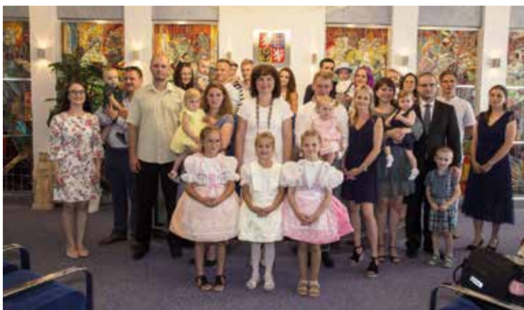
Vítání do života