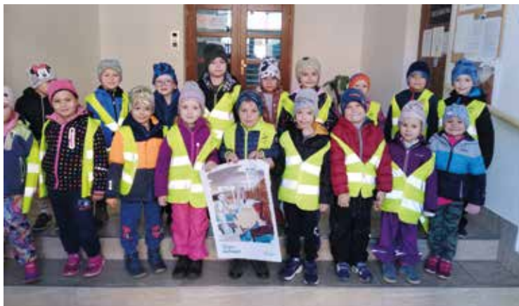
Týden knihoven 2021 s MŠ

Rok 2021 byl pro mne osobně velmi zajímavý. Ve dnech 3. – 5. srpna jsem se zúčastnila semináře - 17. Celostátního setkání knihovnických seniorů v pražském