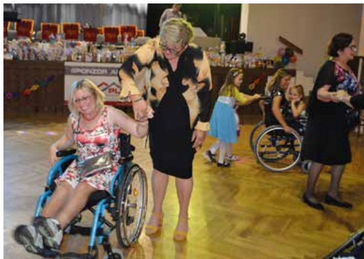
21. Slováký humanitární ples

Tradiční Svatováclavské krojované hody se uskutečnily v termínu 26.–28. září. Předcházel jim Večer u cimbálu v režii cimbálové