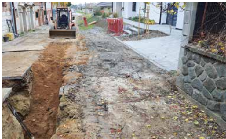
Kanalizace Pod Ořechy