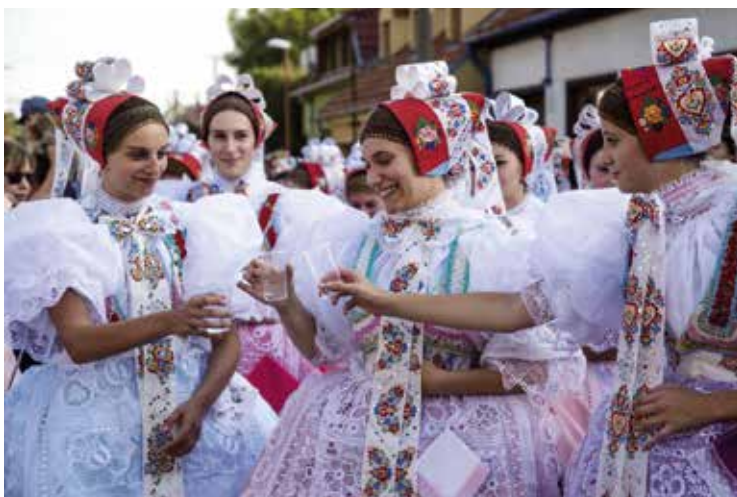
Tradiční Svatováclavské krojované hody