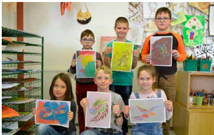
Tvoření obrázků z písku – pískování

■ V zimním období vyrazili za kulturou do divadla Radost v Brně pářáci na představení Čaroděj ze země Oz a třetáci na příběh o Pipi Dlouhé punčošce. Po roce k nám opět zavítalo Divadélko pro školy z Hradce Králové s představením Divadlo nekoře. Jejich pořady jsou vždy zárukou poučení, ale také zábavy. Ne jinak tomu bylo i tentokrát, kdy herci žákům 5. až 9. tříd představili humornou a zábavnou formou různé divadelní žánry. Rušné únorové odpoledne plné her, tance a soutěží si užily děti ze Školní družiny při rejji masek