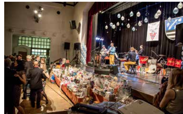
Ples Regionu Podluží

opravdu zajímavé životní příběhy našich rodáků. Přednáška p. Františka Trávníčka se uskuteční patrně až na podzim, ale publikace bude k dispozici na obecním úřadě.