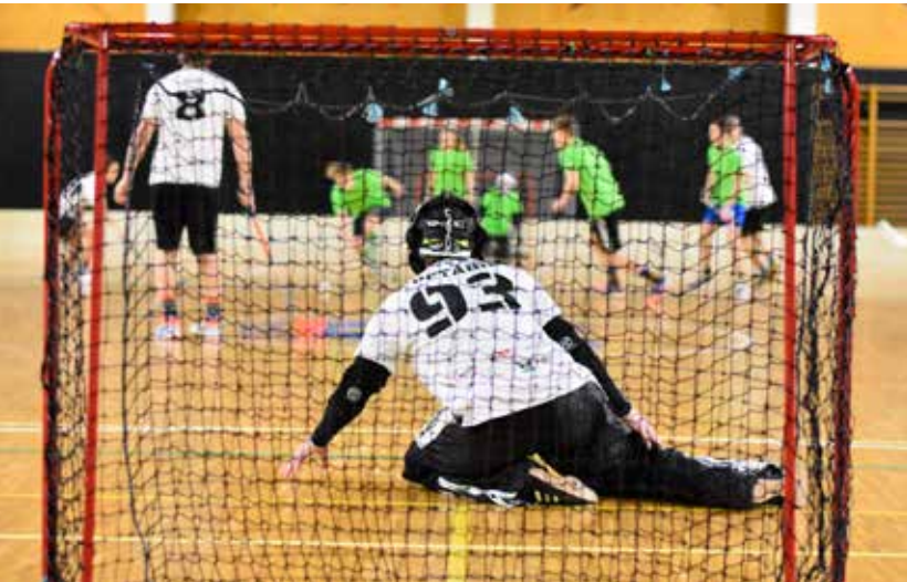
Silvestrovský turnaj dospělých

nost týmy se sportovci z Dolních Bojanovic. Letos ale ani to nestačilo, tak bylo přidáno pravidlo další – nejméně dvě ženy v týmu . Každý tým pojal turnaj jinak. Někdo přišel shodit pár kilo po svátcích, někdo oprášit své florbalové schopnosti a někteří přišli jednoduše zvítězit. Turnaj byl přes všechno po celou dobu v přátelském duchu, k čemuž jistě pomohla také samotná účast žen a dívek. Zápasů během turnaje jsou sice krátké, ale o to intenzivnější, i proto si řada účastníků sáhla na fyzické dno. To poukázalo na fakt, že i přes názory některých „odborníků“ florbal není pro žádná ořezávátka!