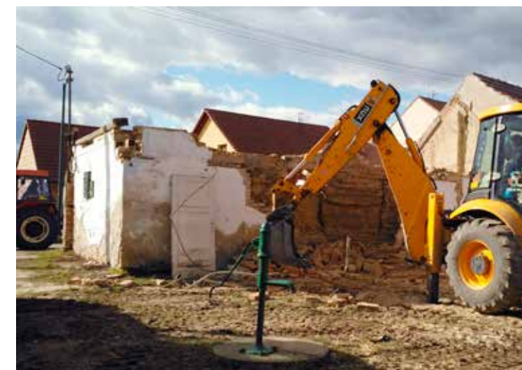
Demolice domu v ulici Na Hrázce