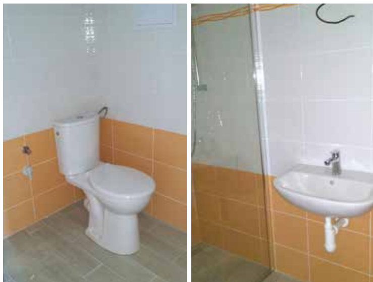
Oprava sociálních zařízení na Domě s pečovatelskou službou