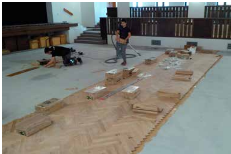
Oprava podlahy v Obecním domě

Připravujeme investiční akce na letošní rok – projektové dokumentace. Bytový dům Na Hrázce 62 čeká rozsáhlá rekonstrukce. Z důvodu havarijního stavu jsme museli nechat provést výměnu stupaček. Projektově se připravuje řešení odvětrání bytů, výměna otvorových prvků, zateplení objektu, vč. stropů ve sklepě, zateplení střechy vč. výměny krytiny, kompletní řešení kotelny. Na tuto akci bychom chtěli požádat o dotaci