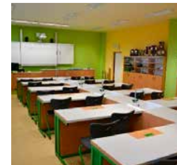
Realizovaná učebna v ZŠ Dolní Bojanovice

seminářů a workshopů, proběhly besedy s autory v knihovnách, akce malování zdi či úspěšná interaktivní výstava Poznávej se.