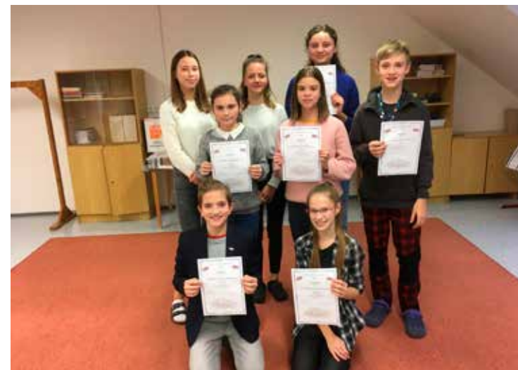
Účastníci olympiády z angličtiny

■ V zimním období vyrazili za kulturou do divadla Radost v Brně pářáci na představení Čaroděj ze země Oz a třetáci na příběh o Pipi Dlouhé punčošce. Po roce k nám opět zavítalo Divadélko pro školy z Hradce Králové s představením Divadlo nekoře. Jejich pořady jsou vždy zárukou poučení, ale také zábavy. Ne jinak tomu bylo i tentokrát, kdy herci žákům 5. až 9. tříd představili humornou a zábavnou formou různé divadelní žánry. Rušné únorové odpoledne plné her, tance a soutěží si užily děti ze Školní družiny při rejji masek