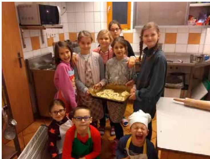
Pečeme! Vaříme! Smažíme!

že nefunguje! Na Orlovně probíhají kroužky Šikovné packy, Dopravák, kroužek vaření. Členové Orla zde mohou navštěvovat posilovnu. Konají se zde výstavy, orelské akce, rady, semináře, spaní na Orlovně pro děti a slouží také jako zázemí pro většinu orelských aktivit. Po zápasech tam sportovci chodí zhodnotit zápasy a utužit kolektiv.