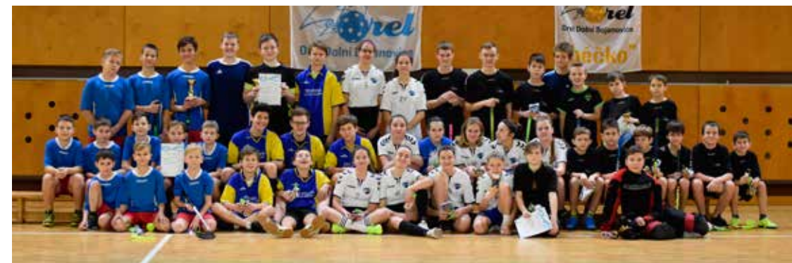
Silvestrovský turnaj dětí