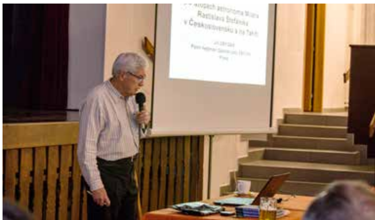
Přednáška Jiřího Grygara

Národopisný soubor Břeclavan v letošním roce oslavil 65 let od svého založení. Tuto významnou událost se rozhodl pojmut ve velkém stylu a uspořádal v rodné Břeclavi hned dva narozeninové koncerty po sobě. Oba byly již týdny před konáním beznadějně vyprodané a nabízelo se nově secvičený program prezentovat ještě jednou. Volba nakonec padla na naši obec, neb i dva zdejší rodáci tvoří „mančaft“ Břeclavanu. Ten se zde představil v nedělním odpoledni dne 24. listopadu před zaplněným sálem. Jádrem vystoupení tvořila směs pásem z Podluží, poukazující na tři významné folklorní motivy: lásku, zábavu a vojnu. Přestože je Břeclavan podlužáckým souborem, není tajemstvím, že do svého repertoáru zařazuje i tance z jiných regionů - s velkou odezvou jsme zde mohli sledovat tance ze Strání, humornou roztržku bab na tržnici či boj chlapců o svůj širák. Dramaturgicky vyvážené vystoupení, které vyvrcholilo ohnivými tanci z Myjavy a Silické planiny, bylo zpestřeno sólovými