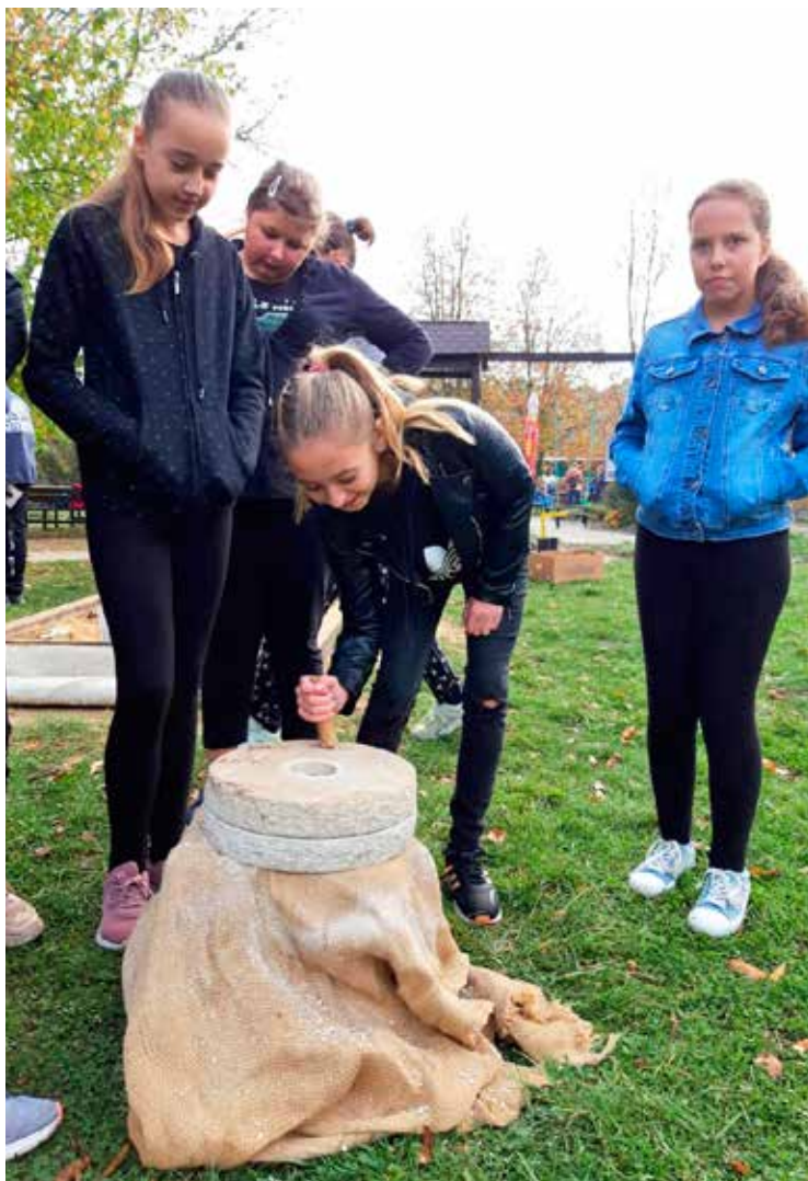
Den s archeologem

■ V předvánoční čas začínají i ve škole vonět perníčky, které žáci chystají na vánoční dílny. Na chodbách a oknech se objevují hvěz-