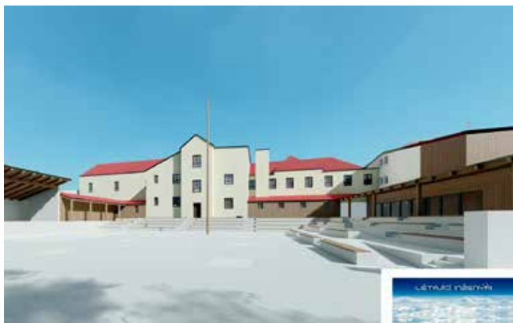
POHLED NA HLAVNÍ VSTUP DO AREÁLU