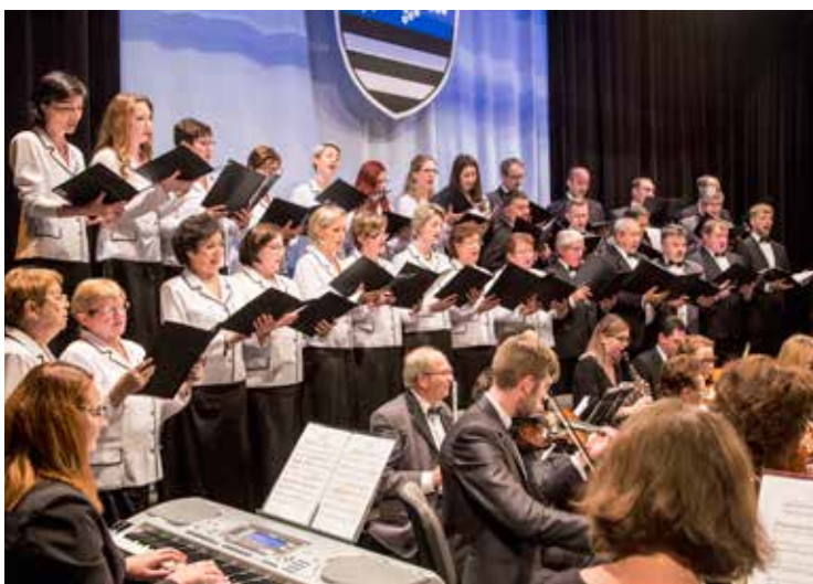
Koncert ke třiceti letům svobody