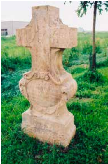
Proměna Heisigova kříže