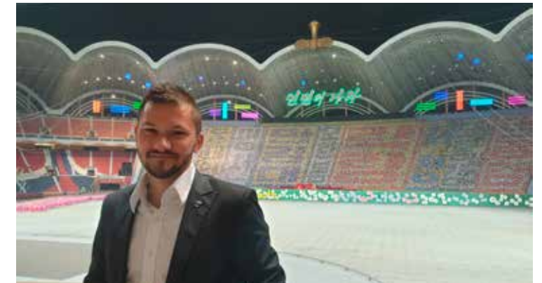
Největší stadion v Asii v Pchongjangu. Obrazec vzadu a tribuna je vytvořen z lidí, během představení se mění.