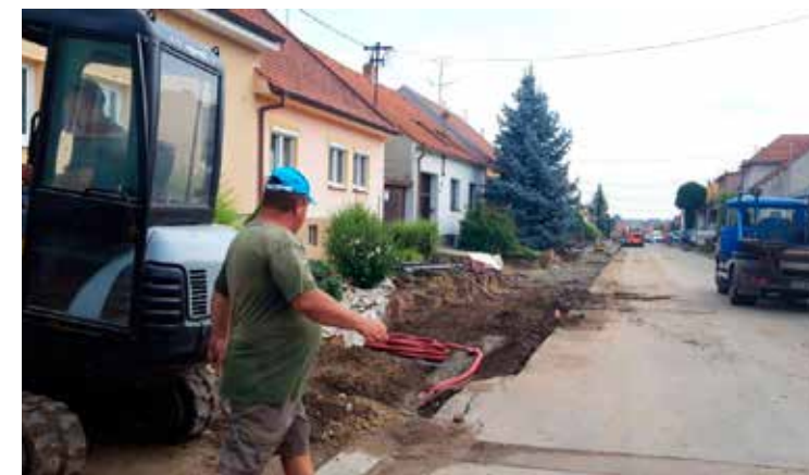
Výstavba chodníků v ulici Spodní Pustá

V červnu byla ukončena rekonstrukce lesní cesty, projekt „ Zvýšení kategorie lesní cesty rekonstrukcí stávající LC v lokalitě Stupava v Dolních Bojanovicích “. Celkové náklady činily 6 189 224 Kč, čekáme na proplacení dotace z EU (SZIF) ve výši 80 %. Byla rekonstruována stávající jednopruhová lesní cesta