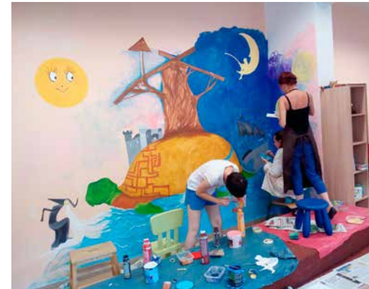
Výmalba dětského koutku žákyněmi výtvarného oboru ZUŠ