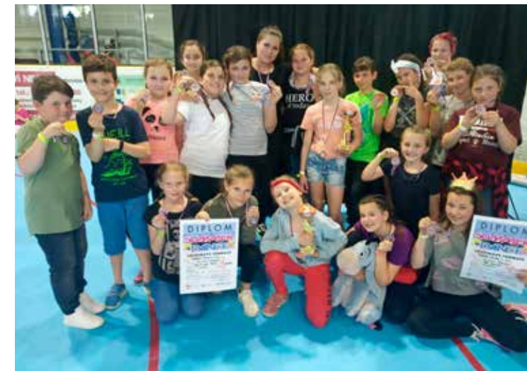
Taneční – děti

Máme otevřeno na 30 kroužků po celém Břeclavsku, Mikulovsku a Hodonínsku. Nemusíte děti nikam vozit, my jezdíme za vámi. Ušetřený čas mohou děti využít zase o něco lépe než sezením v autě či autobuse. Výčet tréninků, kde všude taneční lekce probíhají, který den a v kolik hodin, to vše naleznete na našem webu www.ncod.cz , který by měl být úplně první týden v září.