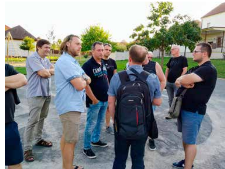
Veřejné projednání studie veřejných prostor

Společnost Prost Hodonín, s. r. o. zpracovává na základě