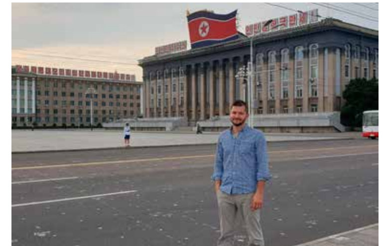
Náměstí Kim Ir Sena v Pchongjangu

Pracovní týden v KLCDR trvá šest dní. O nedělích mají přímo povinnost navštěvovat kulturní a jiné akce, které pořádají pracoviště, fabriky nebo strana. Viděli jsme restaurace, které se rovnají lepším restauracím u nás. Ceny za služby a jídlo jsou ale vysoké i pro turisty, takže běžný občan si je téměř dovolit nemůže. Ale pořád to byl Pchjongjang, takže úplně něco jiného než na venkově, kde ty možnosti nejsou téměř vůbec.