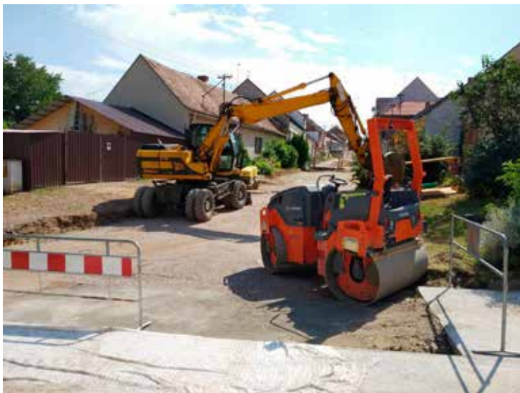
Oprava kanalizace, opěrné zdi a místní komunikace v ulici Cihelny