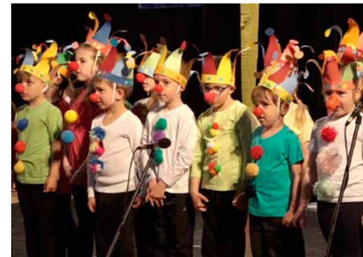
Akademie dětí mateřské školy

Celý program jsme koncipovali jako cirkusové představení, ve kterém každá třída představovala