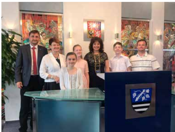
Účastníci celostátního kola soutěže „Bible a my“