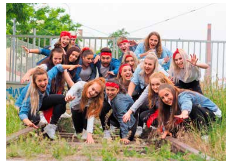
Taneční – dospělí

Hodiny probíhají jednou týdně v pravidelném čase na stále stejném místě a navazují na sebe. Pokud však vynecháte nějakou lekci kvůli nemoci, nic se neděje, pomáháme dětem vše dohnat a neustálým opakováním choreografií se lehce chytí i ti, kteří nezačnou s kurzem hned od začátku září. Nebude se dítě nudit? U nás rozhodně ne. Během školního roku si vyzkouší spoustu různých tanců a technik. STREET DANCE, na který se naše taneční studio zaměřuje, je totiž jen takový nadřazený pojem, jenž zahrnuje nespočet zajímavých tanečních stylů. Z neznámějších můžeme třeba jmenovat hip hop, dancehall, house, lockin, break dance a další, které si děti mají možnost všechny vyzkoušet během kurzů. Z těchto stylů dávají lektori dohromady asi třiminutové choreografie, které jsou složené z více písniček, díky