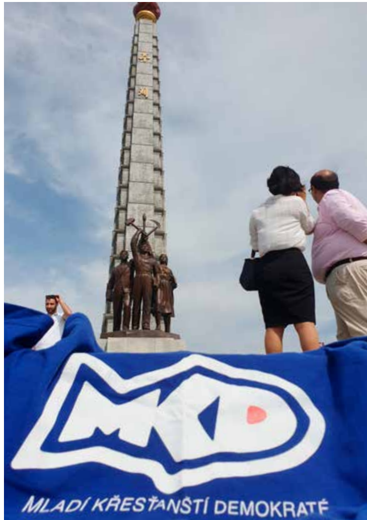
Propagace Honzovi organizace v KLCDR