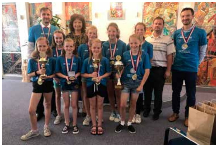
Vítězové republikového finále ČEPS Cupu

jící cyklisty. Věřím, že to zvýší „kredit“ obce, co se týká vybavenosti.