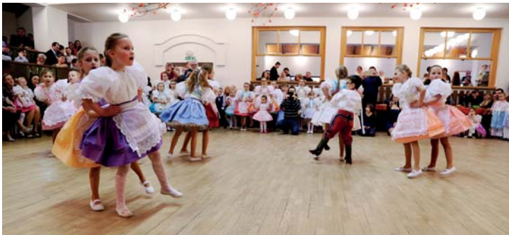
Dětský krojový ples