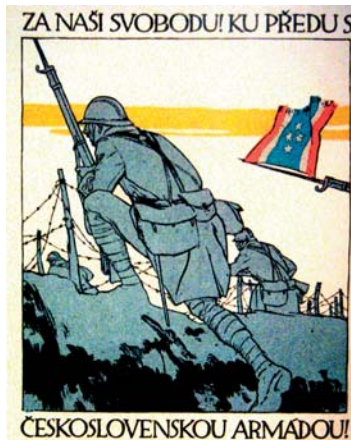
Dobový propagandistický plakát československých legií na západní frontě

Masaryk dosáhl v průběhu roku 1918 (kdy ještě nebylo zdaleka