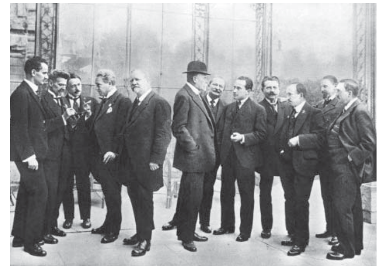
Čeští politici v Ženevě v říjnu 1918

dokumenty byli podepsáni Antonín Švehla, Alois Rašín, Jiří Stříbrný, Vavro Šrobár a František Soukup - později zvaní "Muži 28. října". Tentýž den byli do Národního výboru přibráni 4 zástupci, zástupci Němců a Maďarů nebyli přizváni.