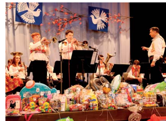
Dětský krojový ples – CM Malina a na fotografii vpravo žakovská kapela ZUŠ z Veselí nad Moravou