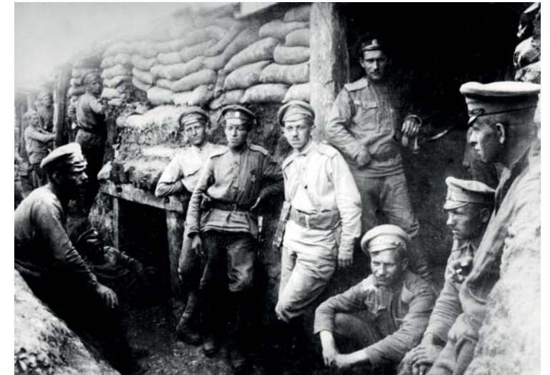
Českoslovenští legionáři v Rusku při bitvě u Zborova (1917)

Večer 28. října vydal Národní výbor první zákon, zákon o zřízení samostatného státu československého, a poté bylo ještě zveřejněno svolání Národního výboru "Lide československý. Tvůj odvěký sen se stal skutkem ...". Pod oběma