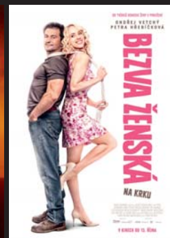
BEZVA ŽENSKÁ NA KRKU

Cena jednotlivé vstupenky je 80 Kč pro dospělé diváky a 50 Kč pro děti. Permanentky je možné zakoupit na Obecním úřadě za 250 Kč. Akce se bude konat za jakéhokoli počasí. Začátky promítání jsou ve 21.30 hod.