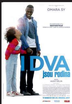
I DVA JSOU RODINA