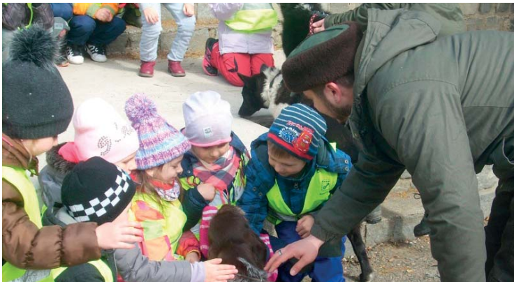
MŠ na Myslivně

V týdnu od 22. do 26. května odjelo 24 předškoláků na školu v přírodě do Čeložnic. Tentokrát s náplní pohádkovou, s tématem Popletené království. Děti prožily pět dnů v přírodě, plnily různé úkoly, zdolávaly rozličné překážky, osamostatnily se od svých rodičů a přivezly si spoustu zážitků.