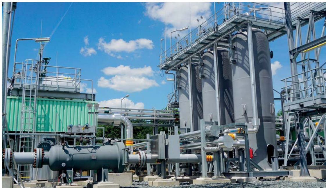
Podzemní zásobník plynu

vyřešení přístupu k pozemkům v části ul. Záhumenice (v zahradách RD) a uložení inženýrských sítí pro další výstavbu RD. Doufám, že do konce roku tuto záležitost dořešíme.