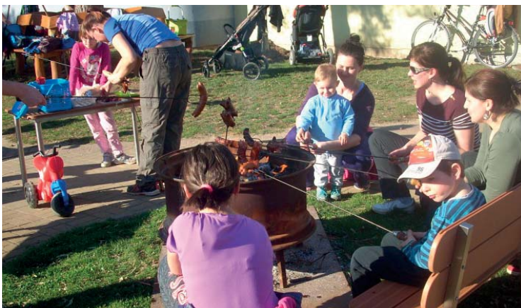
Opékání špekáčků na závěr brigády