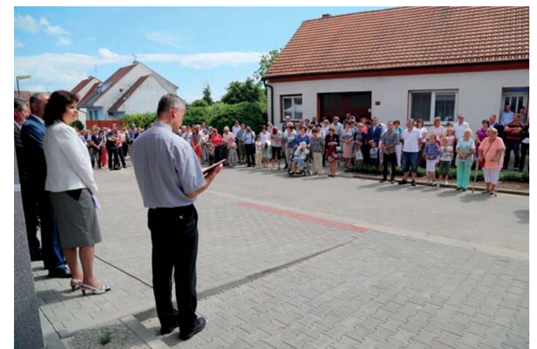
Slavnostní otevření zrekonstruované budovy Zdravotního střediska