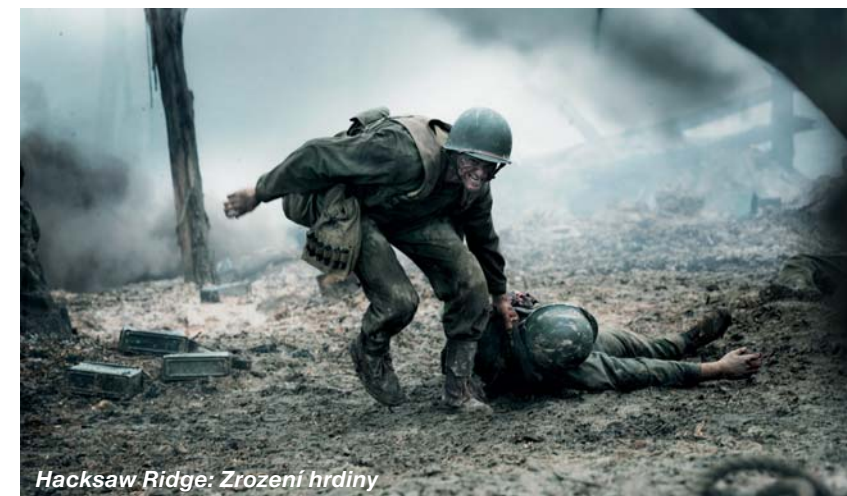
Hacksaw Ridge: Zrození hrdiny