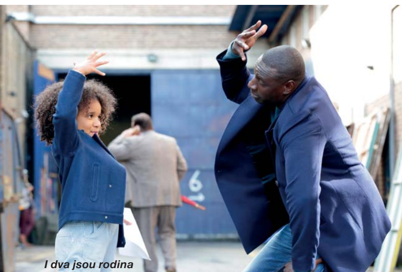
I dva jsou rodina

Letošní promítání Letního kina se uskuteční v termínu 18. – 22. 7. 2017 na fotbalovém hřišti. Začátky promítání budou kvůli světelným podmínkám v 21.30 hod. Vstupné je pro dospělé 80 Kč a pro děti 50 Kč. Opět bude možné zakoupit permanentku za 250 Kč a to na Obecním úřadě nebo v prodejně Boteko. Filmy, které bude kino promítat, představujeme prostřednictvím oficiálních textů distributorů.