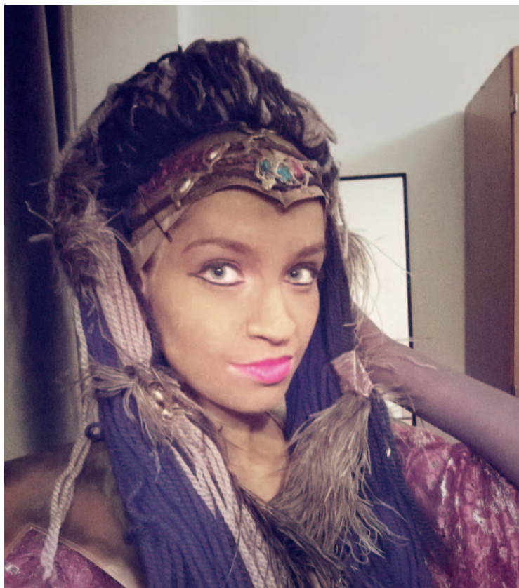
Speciální líčení je součástí představení (z opery Aida)

na Slovensku, kde jsme dosáhli i několika úspěchů. Společně jsme fungovali zhruba do roku 2013.