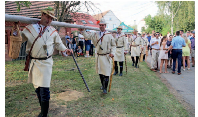
Zahrávání hodů a zarážání hory