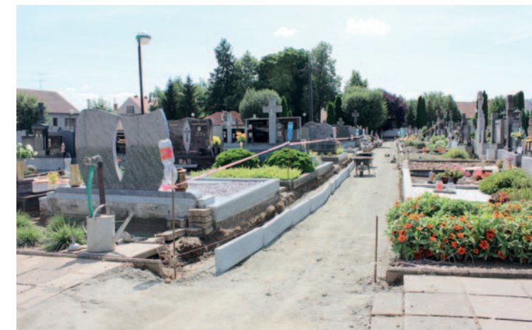
Nové chodníky na hřbitově