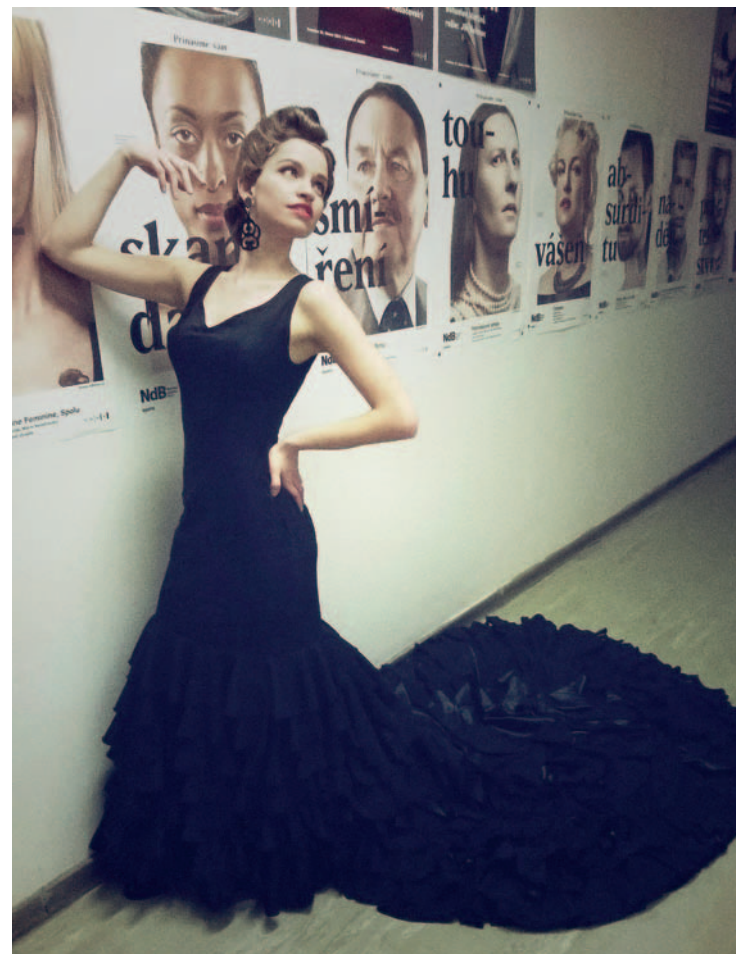
Každá role vyžaduje jiný kostým

Měla. Nejde o to, že bych přišla na zkoušku a zkusila si to. Ale přišla jsem hodinu před začátkem představení, kadeřnice mě učešala, oblékli mi šaty a pan Mrkvička mi