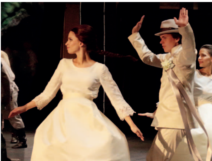
Šárka si vyzkoušela i lidový tanec (z představení Její pastorkyňa)

Není ti líto, že nemůžeš tanec dělat profesionálně – třeba jít na konzervatoř a věnovat se tomu? Není. O konzervatoři jsem chvíli uvažovala, ale rodiče mi to vymluvili. Jsem jim za to nesmírně vděčná. Spousta tanečníků se