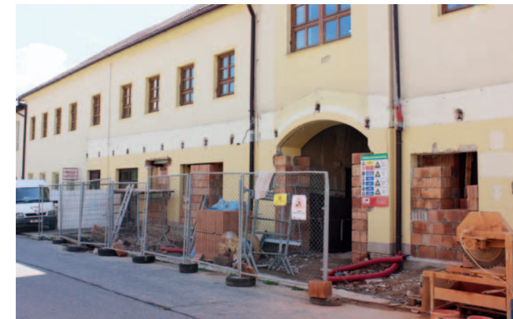
Rekonstrukce budovy ZUŠ

rovněž knihovny. Byla odstraněna venkovní rampa i s přístřeškem. Stavbu provádí firma RENOVA, stavební a obchodní spol. s r.o., celkové náklady činí 5,7 mil. Kč vč. DPH. Z Jihomoravského kraje se nám podařilo získat na tuto akci dotaci ve výši 600 tis. Kč. Práce by měly být ukončeny koncem října. Po tuto dobu budou žáci ZUŠ vstoupovat do budovy ze dvora. Děkuji za pochopení a za spolupráci řediteli a zaměstnancům ZUŠ.